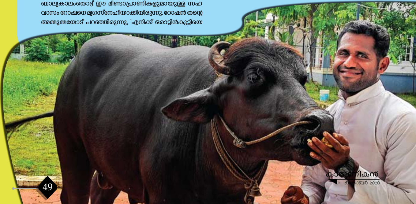
കാർമ്മൽഗിരികൻ ഒക്ടോബർ 2020

പക്ഷി-മൃഗസ്പന്ദിതം റോഷനിൽ രൂപമുദ്രമായിരുന്നെങ്കിലും തന്റെ ജീവിതാന്തസ് മനുഷ്യരെ പിടിക്കുന്നവനാകലാണെന്ന തിരിച്ചറിവ് പത്താംക്ലാസിലെത്തിയപ്പോൾ ബോധ്യമായി. ആ ബോധ്യം 2001 ജൂലൈ മുനിസിപ്പൽ റോഷനെ കളമശ്ശേരി വിയാനിഹോമിലെത്തിച്ചു. ലക്ഷ്യം മുനിസിപ്പൽകണ്ടുകൊണ്ടുള്ള യാത്രയിൽ കാർമ്മൽഗിരി സെന്റ് ജോസഫ്സ് പൊന്തിപിക്കൽ