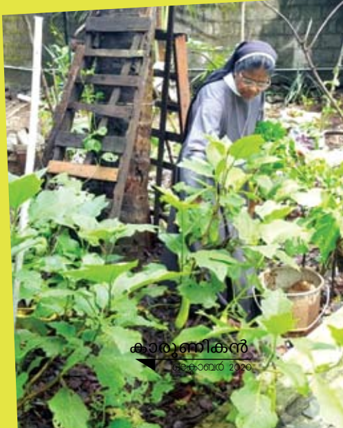
കാശിനികൻ ഒക്ടോബർ 2020

അധ്യാപികയുടെ കൃഷിസന്ദേഹം രെയോപികയെന്ന നിലയിൽ സി. ആന്റിസ് നിരീക്ഷണപാടവം കൂടുതലായിരുന്നു. അത് തന്റെ വിദ്യാർത്ഥികളെ പഠിപ്പിക്കുന്നതിനുവേണ്ടി മാത്രമായിരുന്നില്ല. പ്രകൃ