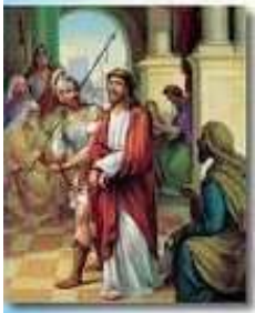
The First Station Jesus is Condemned to Death