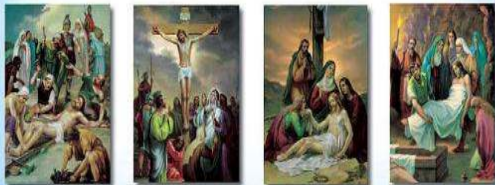
The Eleventh Station