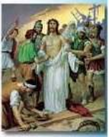
The Tenth Station Jesus is Stripped of His Garments

येसु प्रेम कर दान दे ऐसा, तेरे दिल में ज्वलित जैसा, ख्रीस्त तब लेगा दिल मेरा॥