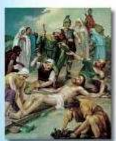
The Eleventh Station Jesus is Nailed to the Cross

प्रार्थना : हे निर्दोष येसु, इस नए दुःख के पुण्यफलों के द्वारा मुझे यह कृपा दे, कि मैं दुनियाई और शारीरिक चिन्ताओं को त्याग दूँ, और अपना पूरा प्रेम तुझी पर रख दूँ। तू ही मेरे प्रेम के योग्य है।