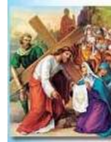
The Sixth Station Veronica Wipes the Face of Jesus

प्रार्थना : हे प्राणप्यारे येसु, मैं सिमोन के समान तेरा क्रूस ढोने से इनकार न करूँगा। मैं आनन्द से उसको ग्रहण करता हूँ, मैं विशेष करके वह मरण और उसके सब दुःख ग्रहण करता हूँ जिसे तूने मेरे लिए ठहराया। मैं तेरे मरण के साथ-साथ यह सब कुछ तुझे चढ़ाता हूँ। तू प्रेम के कारण मेरे लिए मर गया, मैं भी तेरे लिए मरना चाहता हूँ। पर अपनी कृपा से मुझे सहायता दे।