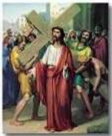
The Second Station Jesus Carries His Cross

प्रार्थना : हे पूज्य येसु, तुझे प्राणदण्ड दिलाना पिलातुस का नहीं, पर मेरे पापों का काम था। मैं हाथ जोड़ के तुझसे विनती करता हूँ। तू अपनी इस दुःखमयी यात्रा के पुण्यफलों के द्वारा, जो यात्रा मैं स्वर्ग की ओर कर रहा हूँ, उसमें मुझे सहायता दे। हे येसु, मैं तुझे सबसे अधिक प्यार करता हूँ। मैं सारे हृदय से पछताता हूँ कि मैंने पाप किया है। ऐसा कर कि मैं तुझसे फिर कभी अलग न हो जाऊँ, पर तुझे सदा प्यार करूँ। अब जैसा तू चाहता है वैसा ही मेरे साथ कर।