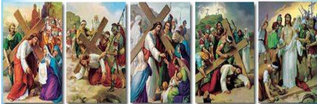
The Sixth Station