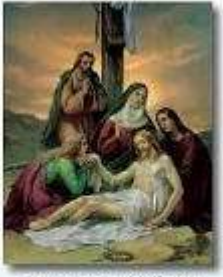
The Thirteenth Station Jesus is Taken Down from the Cross