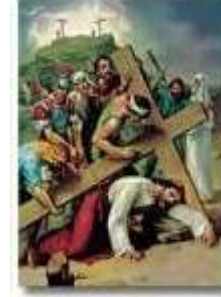
The Ninth Station Jesus Falls the Third Time

प्रार्थना : हे शोक से भरे येसु, मैं अपने पापों के कारण रोता हूँ। इनके द्वारा मैं न केवल नरक के योग्य बन गया, परन्तु मैंने तुझे अप्रसन्न किया है, जब कि तूने मुझे इतना प्यार किया है। नरक और विशेष करके तेरे प्रेम का स्मरण करता हुआ, मैं अपने पापों के कारण रोता हूँ।