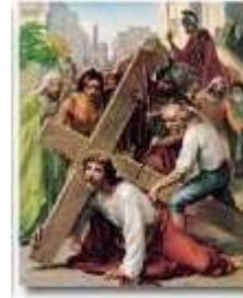
The Third Station Jesus Falls the First Time

प्रार्थना : हे प्राणप्यारे येसु, जो दुःख-कष्ट मुझे अपने मरण तक उठाने पड़ेंगे, उन्हें मैं सारे हृदय से ग्रहण करता हूँ। मैं गिड़गिड़ाके तुझसे विनती करता हूँ उस दुःख के पुण्यफलों द्वारा, जिसको तूने क्रूस ढोते समय उठाया, मुझे सहायता दे, जिससे मैं पूरे धीरज और त्याग से अपना क्रूस ढोऊँ।