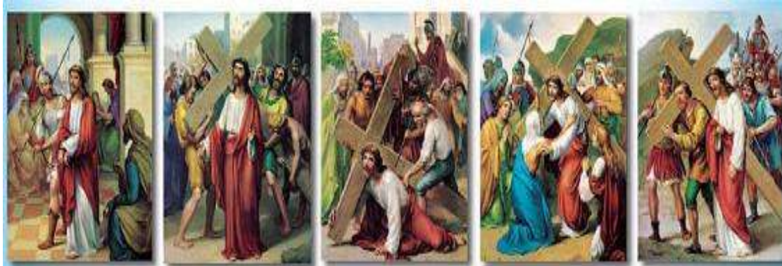
The First Station