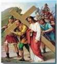
The Fifth Station Simon Helps Jesus to Carry the Cross

प्रार्थना : हे मधुर येसु, उस बड़े दुःख के द्वारा, जिसको तुझे इस भेंट में उठाना पड़ा, मेरे हृदय में पवित्र माँ के प्रति सच्ची भक्ति डाल दे। और तू मेरी रानी, जो दुःखसागर में डूबी थी, मुझे यह कृपा दिला कि मैं तेरे पुत्र के दुःखभोग की याद करूँ।