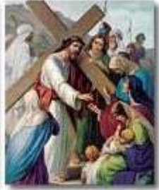
The Eighth Station The Women of Jerusalem Weep over Jesus

प्रार्थना : हे अति मधुर येसु, कितनी बार तूने मेरे पापों की क्षमा की और कितनी बार मैंने अपने नए पापों से तुझे फिर अप्रसन्न किया है। कृपा करके तेरे दुबारा गिरने के पुण्यफलों के द्वारा, मुझे आवश्यक सहायता दे, जिससे मैं मरने तक कृपा की दशा में रहूँ। ऐसा कर कि हर परीक्षा में मैं जल्दी तेरे पास सहायता माँगने आऊँ।