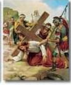
The Seventh Station Jesus Falls the Second Time