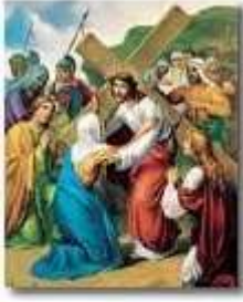
The Fourth Station Jesus Meets His Sorrowful Mother