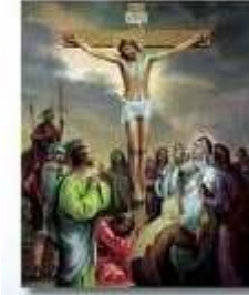
The Twelfth Station Jesus is Raised upon the Cross, and Dies

प्रार्थना : हे निन्दा से लदे हुए येसु, मेरा हृदय सदा तेरे चरणों में लीन रहे, तुझे प्यार करे, और तुझको कभी न छोड़ दे।